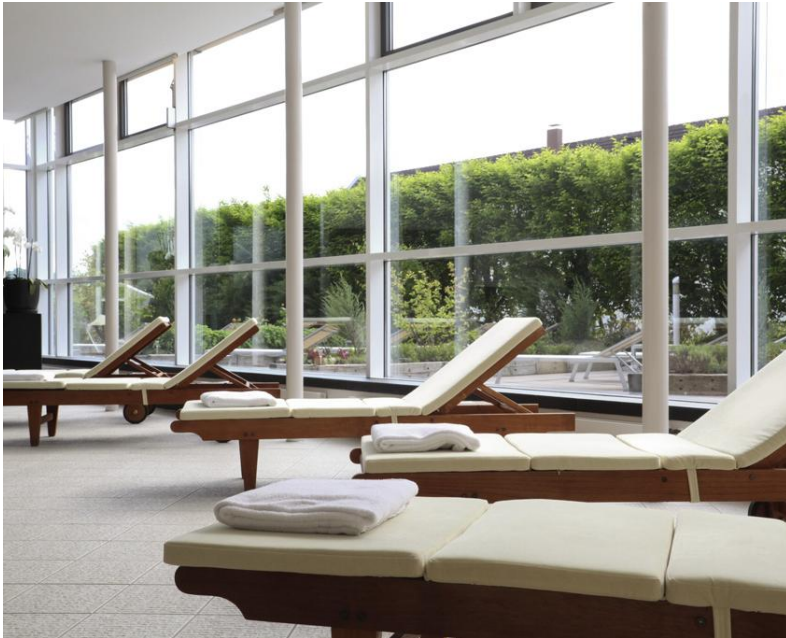
Spacious relaxation and recreation area with sun terrace Großzügigen Ruhe- und Erholungslandschaft mit Sonnenterrasse